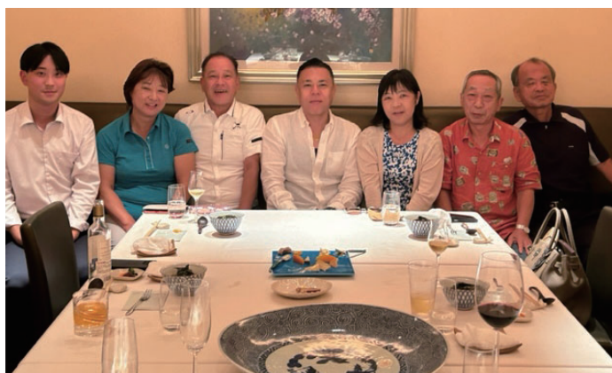
2日目夜 食事会「葛(かずら)」