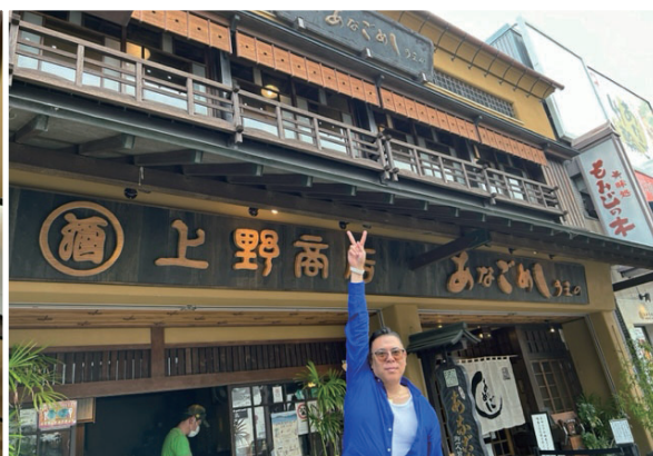
9 / 14 ~ 16 親睦旅行 上野商店「他人吉」穴子づくしコース